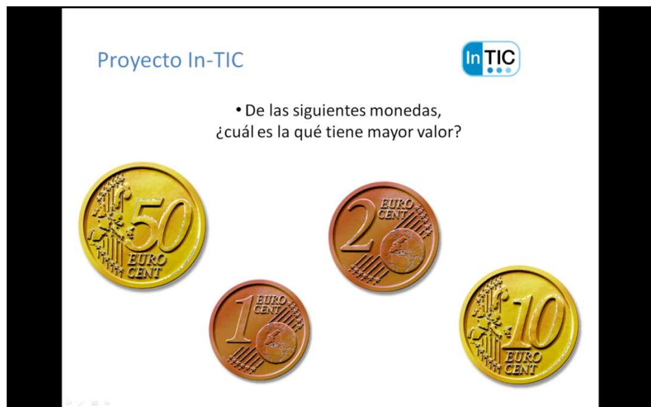
Figura 3. El usuario debe señalar la moneda que tiene mayor valor con respecto a las otras.