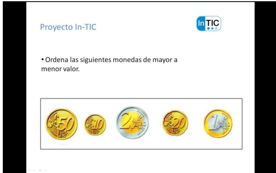
Figura 4. En este ejercicio, la persona debe ordenar las monedas que se le muestran en función del valor que representan.