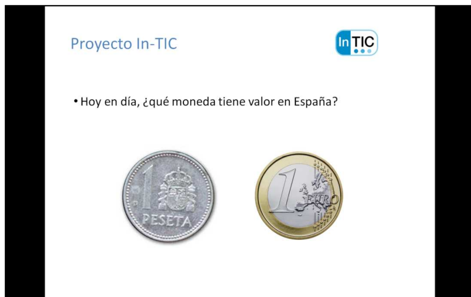
Figura 1. En este ejercicio, la persona debe indicar la moneda que está actualmente en vigor en España.