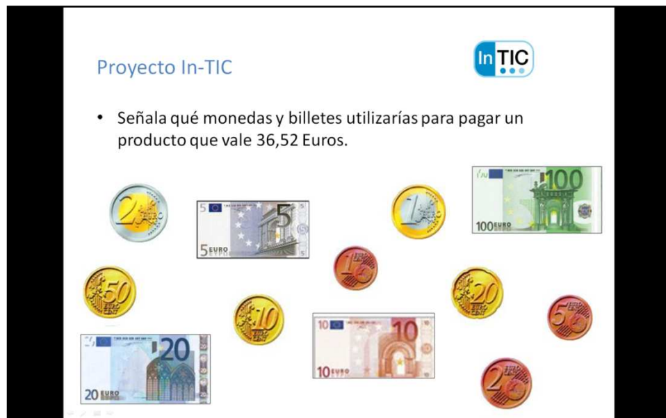
Figura 5. Finalmente, se propone un ejercicio en el que el usuario tiene que indicar las monedas y billetes necesarios para pagar un determinado artículo.